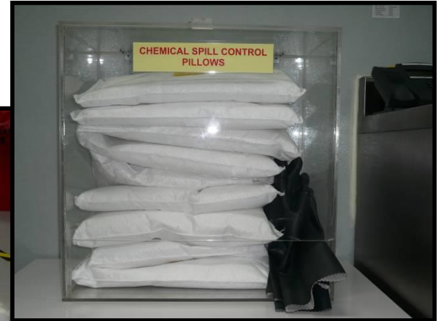
ប្រអប់ករណីកំពប់សារ ធាតុគីមី