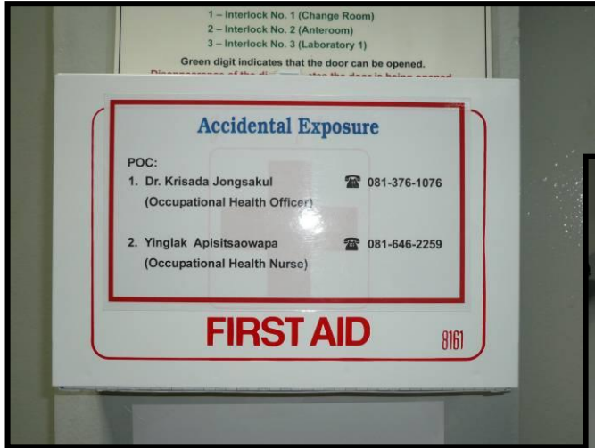
ប្រអប់សង្គ្រោះបឋម